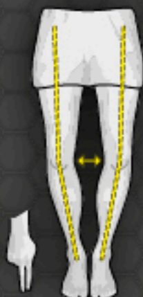
1 Bow Leg O-Bein