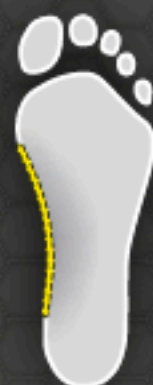
D Flat Arch Flachfuß