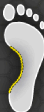
C Low Arch Senkfuß