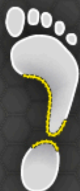
A High Arch Hohlfuß