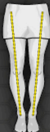
2 Straight Leg Gerades Bein