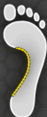
B Medium Arch Normalfuß