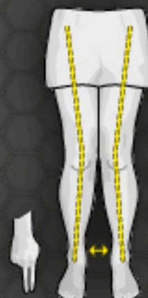
3 Knock Knees X-Bein